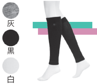
ニューレッグウォーマー ショート 3,400円