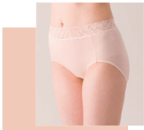
より添うインナー 婦人ショーツ 4,700円