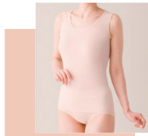
より添うインナー 婦人ノースリーブ 6,200円