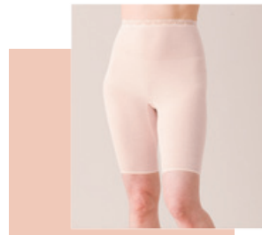
より添うインナー 婦人5分パンツ 7,500円