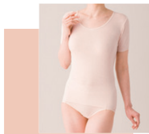
より添うインナー 婦人半袖 7,500円