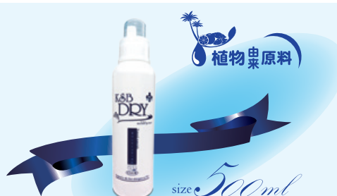
K&Bドライ ハンディボトル 500ml 1,980円