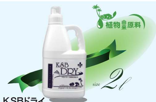
K&Bドライ 2ℓ 5,200円