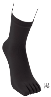
黒 婦人5本指ソックス 3,600円