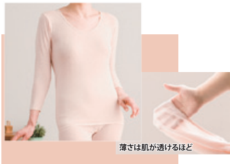
より添うインナー 婦人8分袖 8,800円