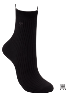
黒 婦人オールシーズンソックス 2,800円