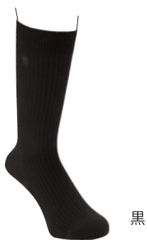
黒 紳士オールシーズンソックス 3,100円