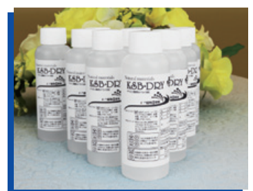
K&Bドライ ミニ洗剤 100ml × 10 5,700円