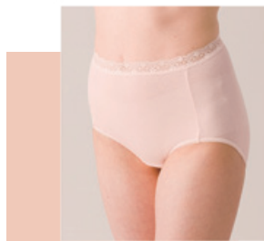
より添うインナー 婦人ハイウエスト 5,700円