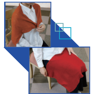
カラービューティークロス (3本) 7,700円